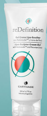
Gel Crema Lipo-Escultor x 200ml

Modela el contorno del cuerpo, combate la adiposidad localizada, corrige el aspecto de la piel con celulitis y posee efecto drenante.