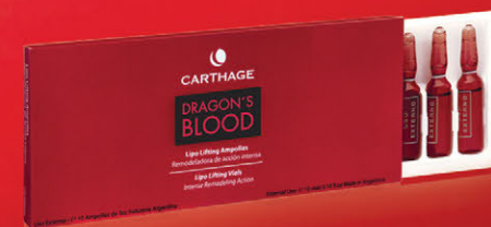
Lipo Lifting Ampollas x 10 u de 3cc.

Tratamiento de potente acción correctiva, tensora y antiage para arrugas profundas y pérdida de firmeza. Combate eficazmente la flacidez y remodela el volumen del contorno óvalo facial, cuello y mentón.