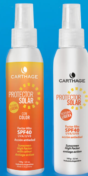
Protector Solar Factor Alto SPF 40 Textura Ligera x 100ml CON y SIN COLOR

Protector solar de acción antiedad que facilita un bronceado uniforme y seguro. Su textura ligera es ideal para pieles normales y grasas.