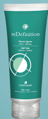
Gel Piernas Ligeras x 200ml

Un programa completo y eficaz que realiza cuatro acciones simultáneas: reduce el contorno corporal, promueve el drenaje disminuyendo la retención de líquidos, reafirma la piel y combate la celulitis rebelde mejorando su aspecto.