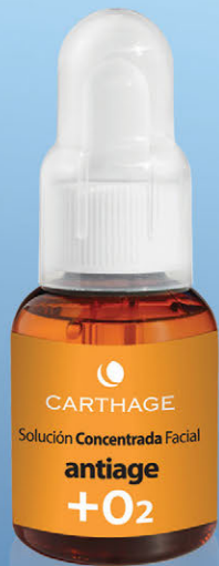
Solución Concentrada Facial Antiage + O2 x 25cc.

Activan la oxigenación de la piel, hidratan, combaten el envejecimiento prematuro y la protegen del estrés ambiental. Apto aparatología y combinables con los productos Carthage.