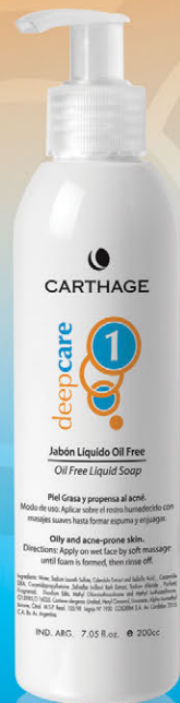
Jabón Líquido Oil Free x 200cc.

Programa de tratamiento para prevenir y combatir el acné en pieles grasas o mixtas.