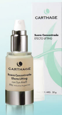
Suero Concentrado Efecto Lifting x 30g

Con el exclusivo activo Synake® a base de veneno de víbora, permite la relajación de las contracciones del músculo facial dando como resultado una piel lisa.