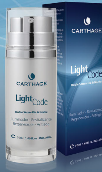
Doble Serum Día y Noche x 50ml

Una combinación de principios activos de vanguardia especialmente seleccionados para revelar la luz de una piel joven, uniforme y perfecta.