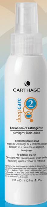
Loción Tónica Astringente x 125cc.

Reduce el tamaño de los poros y controla la oleosidad de la piel dejándola fresca y limpia.