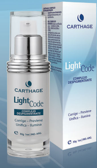
Complejo Despigmentante x 30g

Corrige - Previene - Unifica - Ilumina. Cuidado específico para el tratamiento de las hiperpigmentaciones y el fotoenvejecimiento. Unifica de manera excepcional el tono y la textura cutánea dejando el cutis uniforme y luminoso.