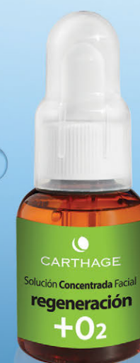
Solución Concentrada Facial Regeneración + O2 x 25cc.

Tratamiento activador de la oxigenación para pieles desvitalizadas.