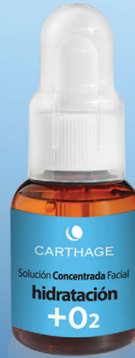
Solución Concentrada Facial Hidratación + O2 x 25cc.

Tratamiento activador de la oxigenación para hidratación profunda.