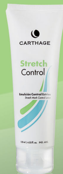
Stretch Control Emulsión Control Estrías x 120ml

Emulsión regeneradora y nutritiva que previene y atenúa el aspecto de las estrías recientes otorgando tonicidad y elasticidad a la piel.