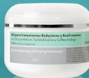
Gel para Tratamientos Reductores y Reafirmantes x 250cc.

Productos potenciados contra la celulitis y la obesidad localizada. Estimulan la actividad lipolítica, combaten la flacidez y favorecen el drenaje de los líquidos retenidos en los tejidos. Mejoran la microcirculación aportando firmeza y tonificación a la piel.