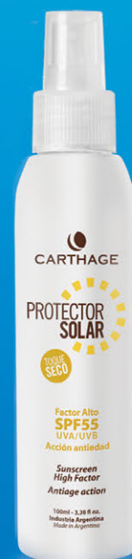
SPRAY Protector Solar Factor Alto SPF 55 Toque Seco x100ml

Protector solar spray transparente, toque seco de acción antiedad que facilita un bronceado uniforme y seguro. Previene el envejecimiento prematuro y la aparición de arrugas y manchas. Su textura fresca y de rápida absorción es ideal para pieles grasas, mixtas, normales y sensibles.