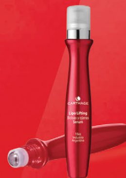
Lipo Lifting Bolsas y Ojeras Serum x 15cc.

Acción drenante y correctora. Reafirma, descongestiona y reduce las bolsas minimizando las ojeras y arrugas.