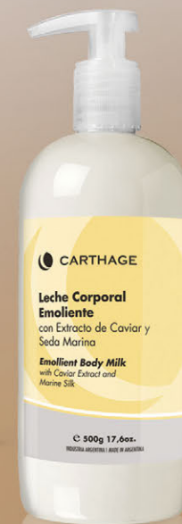
Leche Corporal Emoliente x 500g

Proporciona a la piel tersura, firmeza y suavidad dejándola fresca y perfectamente hidratada.