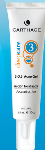
S.O.S. Acné Gel x 30g

Actúa en forma localizada eliminando y previniendo la formación de acné. Sus propiedades astringentes, antisépticas, calmantes y cicatrizantes reducen las impurezas de los poros.