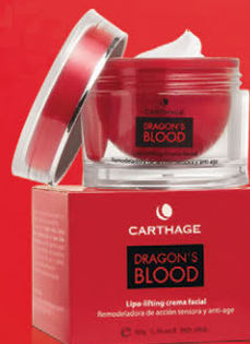
Lipo Lifting Crema Facial x 50g

Crema de acción correctiva, eleva los rasgos del óvalo facial gracias a su poder reafirmante y reestructurante. Reduce la flacidez y aumenta la elasticidad protegiendo y fortaleciendo las fibras de colágeno.