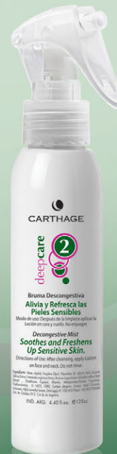
Bruma Descongestiva x 125cc.

Calma, relaja y reequilibra la piel aportándole la hidratación necesaria.