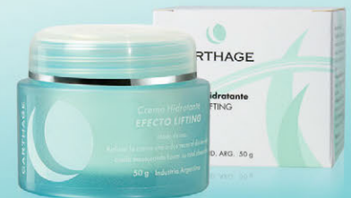
Crema Hidratante Efecto Lifting x 50g

Tratamiento antiedad que atenúa las arrugas de expresión a través de la relajación de los músculos faciales. Su suave textura es ideal para pieles normales y secas.