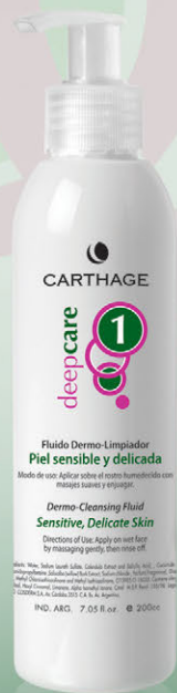
Fluido Dermo-Limpiador x 200cc.

Programa de tratamiento antiedad y reparador que estimula los mecanismos de defensa y alivia la inflamación, disminuyendo las rojeces y otorgando calma y máximo confort a la piel.