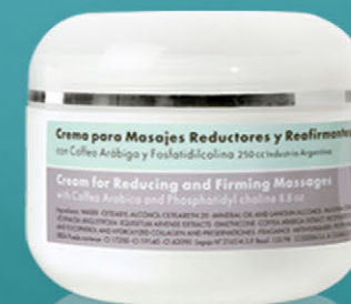
Crema para Masajes Reductores y Reafirmantes x 250cc.

Trata la obesidad localizada, mejora la aparición de la piel con celulitis, combate la flacidez y favorece el drenaje.