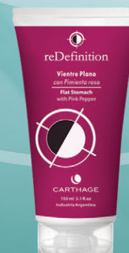
Vientre Plano x 150gr

Tratamiento intensivo para reducir el exceso de adiposidad acumulada en el abdomen. Drena y reafirma la piel flácida hasta recuperar el tono y las formas atractivas.