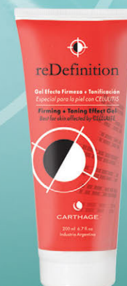
Gel Efecto Firmeza + Tonificación x 200ml

Tratamiento reafirmante y tonificante. Combate la celulitis, estimula la microcirculación y mejora el aspecto de la piel "de naranja". Apto aparatología.