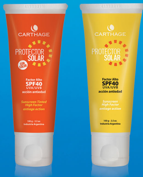
Protector Solar Factor Alto SPF 40 x 100g CON y SIN COLOR

Emulsión protectora solar de acción antiedad que facilita un bronceado uniforme y seguro. Su fórmula dermatológicamente testada proporciona una equilibrada protección de alto espectro UVA / UVB, previene el envejecimiento prematuro y la aparición de arrugas y manchas.