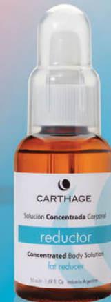
Concentrado Reductor x 50cc.

Tratamiento para las adiposidades resistentes.