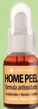
Home Peel Fórmula Antioxidante con Ác. Ferúlico + Vit. C + Lanablué x 25ml

Peeling domiciliario que protege de la oxidación, neutraliza el impacto de los radicales libres en las células retrasando el proceso de envejecimiento cutáneo. Estimula la síntesis de colágeno y elastina, hidrata, renueva y desintoxica.