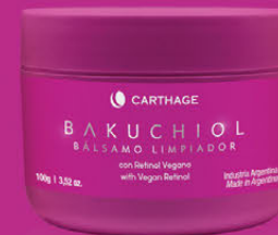
BÁLSAMO LIMPIADOR con Retinol Vegano x 100g

Elimina en profundidad las impurezas, polución, y el maquillaje, incluso el resistente al agua, sin alterar la barrera cutánea. Gracias a sus componentes con Bakuchiol, Aceite de Coco, Aceite de Jojoba y Manteca de Karité nutre e hidrata; su textura sólida se funde al entrar en contacto con la piel dejándola suave y equilibrada.