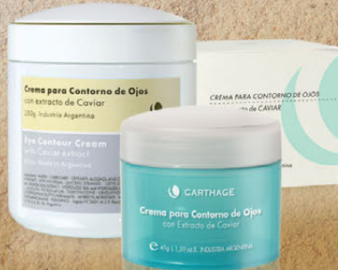
Crema para Contorno de Ojos x 30g y 250g

Productos de lujo a base del exquisito caviar, que aceleran la regeneración cutánea para devolverle vitalidad y lozanía a la piel.