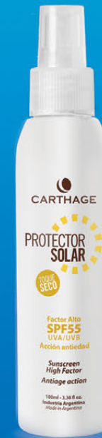
SPRAY Protector Solar Factor Alto SPF 55 Toque Seco x100ml

Protector solar spray transparente, toque seco de acción antiedad que facilita un bronceado uniforme y seguro. Previene el envejecimiento prematuro y la aparición de arrugas y manchas. Su textura fresca y de rápida absorción es ideal para pieles grasas, mixtas, normales y sensibles.