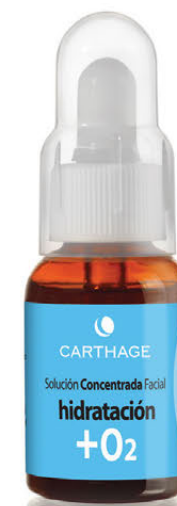
Solución Concentrada Facial Hidratación + O2 x 25cc. con Ácido Hialurónico

Tratamiento activador de la oxigenación para hidratación profunda.