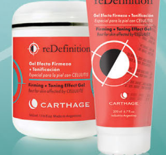
Gel Efecto Firmeza + Tonificación x 200ml y 500ml

Tratamiento reafirmante y tonificante. Combate la celulitis, estimula la microcirculación y mejora el aspecto de la piel "de naranja". Apto aparatología.