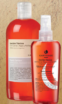
Loción Tónica x 125g y 500g

Tonifica, suaviza e hidrata la piel, restaurando su ph natural.