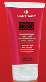
Lipo Lifting Máscara Rostro y Cuello x 150g

Tratamiento de triple acción: antiage, reafirmante y reestructurante. Remodela la zona del óvalo facial consiguiendo un verdadero efecto antigravedad.