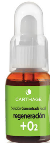
Solución Concentrada Facial Regeneración + O2 x 25cc. con Células Madres

Tratamiento activador de la oxigenación para pieles desvitalizadas.