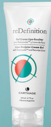
Gel Crema Lipo-Escultor x 200ml

Modela el contorno del cuerpo, combate la adiposidad localizada, corrige el aspecto de la piel con celulitis y posee efecto drenante.