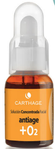
Solución Concentrada Facial Antiage + O2 x 25cc. con Vitamina C

Tratamiento activador de la oxigenación para combatir el envejecimiento cutáneo.