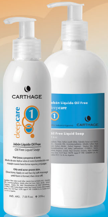
Jabón Líquido Oil Free x 200cc. y 500cc.

Programa de tratamiento para prevenir y combatir el acné en pieles grasas o mixtas.