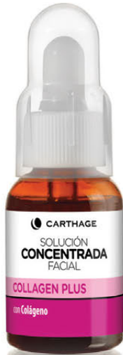
Solución Concentrada Facial Collagen Plus x 25cc. con Colágeno

Tratamiento para disminuir arrugas, recuperar la firmeza y elasticidad de la piel.