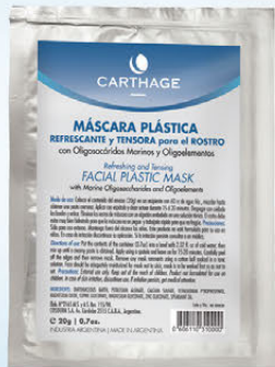
Máscara Plástica Refrescante y Tensora x 20g

Su función principal es oclusiva y tensora. Potencia el resultado de productos antiage, humectantes y descongestivos.