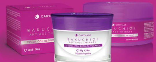
ANTIAGE THERAPY Crema con Retinol Vegano x 50g y 200g

Crema con una combinación única de ingredientes naturales que rejuvenecen la apariencia del rostro. Combate los signos visibles del envejecimiento cutáneo para un efecto anti-edad total: reduce arrugas, recupera la firmeza, combate las manchas, unifica el tono, hidrata, regenera y aporta luminosidad. Posee potentes antioxidantes que neutralizan los radicales libres y el estrés oxidativo. Revitaliza el cutis para lucir una piel tersa, luminosa y radiante.