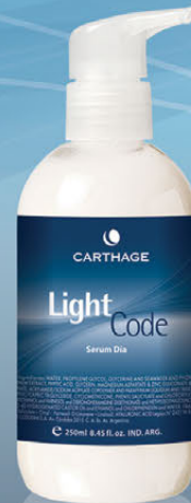
Serum Día x 250ml

Una combinación de principios activos de vanguardia especialmente seleccionados para revelar la luz de una piel joven, uniforme y perfecta.