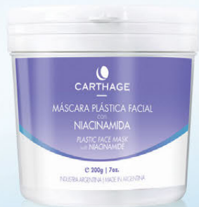
Máscara Plástica Facial con Niacinamida x 200g

Formuladas con alginatos, proporcionan un efecto tensor a la vez que tratan la piel en función de sus necesidades.