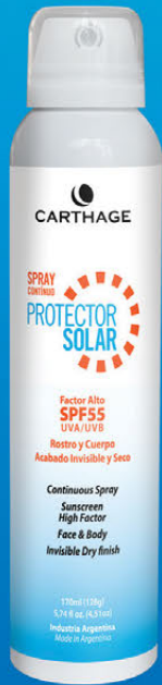
Protector Solar Factor Alto SPF 55 Spray Continuo x170ml (120g)

Protector solar spray continuo facilita un bronceado uniforme y seguro. Su fórmula dermatológicamente testada proporciona una equilibrada protección de alto espectro UVA / UVB, previene el envejecimiento prematuro y la aparición de arrugas y manchas. Su textura en bruma de rápida absorción y fácil aplicación, deja una sensación de frescor y confort muy agradable. De acabado seco e invisible es ideal para todo tipo de piel.