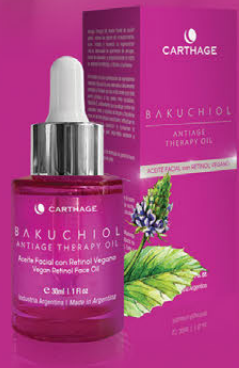
ANTIAGE THERAPY OIL Aceite Facial con Retinol Vegano x 30ml

Apto Veganos Libre de Parabenos Sin TACC No Testeado en Animales