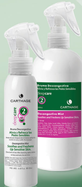
Bruma Descongestiva x 125cc. y 500cc.

Calma, relaja y reequilibra la piel aportándole la hidratación necesaria.