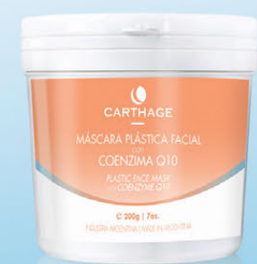
Máscara Plástica Facial con Coenzima Q10 x 200g

Ideal para todo tipo de pieles, fortalece las células al reponer sus niveles energéticos, mejorando la regeneración celular y reduciendo arrugas y líneas de expresión. Posee acción antioxidante que protege la piel del daño oxidativo. Mejora el tono de la piel y aporta luminosidad al rostro.