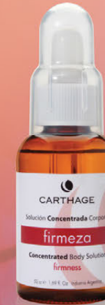
Concentrado Firmeza x 50cc.

Tratamiento para la flacidez persistente.