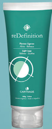
Gel Piernas Ligeras x 200ml

Un programa completo y eficaz que realiza cuatro acciones simultáneas: reduce el contorno corporal, promueve el drenaje disminuyendo la retención de líquidos, reafirma la piel y combate la celulitis rebelde mejorando su aspecto.