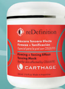
Máscara Tensora Efecto Firmeza + Tonificación x 500ml

Tratamiento reafirmante, tensor y drenante. Ayuda a eliminar la celulitis más rebelde, estimula la circulación y potencia la producción de colágeno recuperando la elasticidad y el tono.