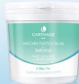
Máscara Plástica Facial con Bardana x 200g

Ideal para pieles acnéicas, grasas y sensibles. Posee propiedades descongestivas y antimicrobianas, disminuye la secreción sebácea y facilita la eliminación de las impurezas de la piel.