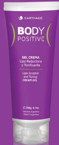
GEL CREMA Lipo Reductora y Tonificante x 200g

Gel crema de acción intensa para redefinir la silueta, reducir la apariencia de la celulitis, aumentar la elasticidad y firmeza de la piel. Combina el poder natural de Silstem-U™, un complejo de extractos de células madres de Cardo Mariano y de hojas de Gayuba que reduce la formación de tejido adiposo, la absorción y almacenamiento de grasa. Enriquecida con Cilantro, Cáscara de Naranja Dulce y Cafeína promueve el proceso natural del lipólisis, mejora la tersura de la piel, reafirma los tejidos y minimiza la apariencia de la celulitis remodelando la belleza corporal.