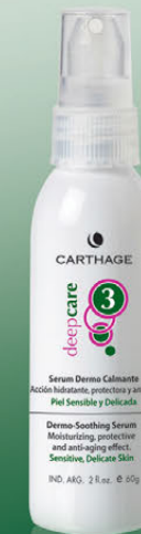
Serum Dermo Calmante x 60g

Ultra reparador y antiedad. Calma, suaviza e hidrata creando bienestar sobre la piel. Sus pigmentos minerales corrigen ópticamente las rojeces unificando la tez.