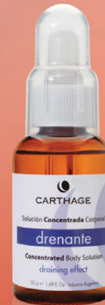
Concentrado Drenante x 50cc.

Tratamiento para la celulitis y disfunciones circulatorias.