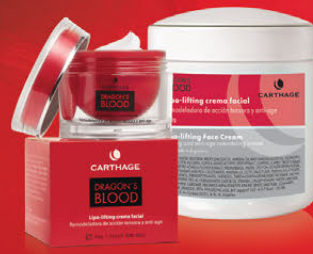
Lipo Lifting Crema Facial x 50g y 250g

Crema de acción correctiva, eleva los rasgos del óvalo facial gracias a su poder reafirmante y reestructurante. Reduce la flacidez y aumenta la elasticidad protegiendo y fortaleciendo las fibras de colágeno.