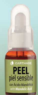
Peel Piel Sensible Renovador Celular con Ácido Mandélico x 25ml

Tratamiento antiage para piel sensible y acnéica. Trata el acné activo, sus secuelas, cicatrices y manchas post acné.