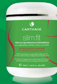
Máscara Lipo-Reductora y Remodelante x 500ml

Tratamiento que redefine el contorno corporal y combate las adiposidades rebeldes.