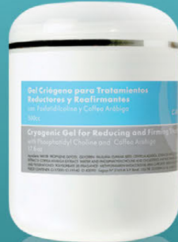
Gel Criógeno para Tratamientos Reductores y Reafirmantes x 500cc.

Gel frío especialmente formulado para problemas circulatorios. Disminuye la celulitis y las grasas localizadas. Con acción reafirmante.