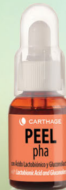
PHA PEEL Renovador Celular con Ácido Lactobiónico y Gluconolactona x 25ml

Tratamiento antiage que concentra la máxima eficacia antioxidante y renovadora, otorgando hidratación, firmeza y elasticidad sin causar picor ni ardor.