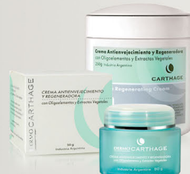
Crema Antienvjecimiento y Regeneradora x 50g y 250g

Promueve la regeneración celular, mejorando la apariencia de los primeros signos de la edad.