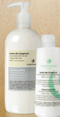
Leche de Limpieza x 200g y 500g

Remove profundamente las impurezas y el maquillaje sin modificar el balance fisiológico de la piel. Hidrata y tonifica.