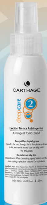
Loción Tónica Astringente x 125cc.

Reduce el tamaño de los poros y controla la oleosidad de la piel dejándola fresca y limpia.