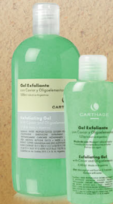
Gel Exfoliante x 125g y 500g

Contiene partículas acrílicas y siliconadas que eliminan las impurezas y células muertas dejando la piel suave y aterciopelada.