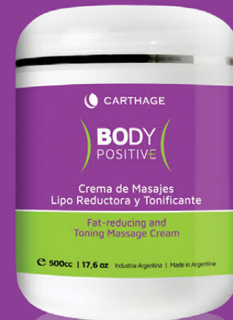
CREMA DE MASAJES Lipo Reductora y Tonificante x 500g

Tratamiento completo de acción intensa para redefinir la silueta, reducir la apariencia de la celulitis, aumentar la elasticidad y firmeza de la piel. Combina el poder natural de Silstem-U™, un complejo de extractos de células madres de Cardo Mariano y de hojas de Gayuba que reduce la formación de tejido adiposo, la absorción y almacenamiento de grasa. Enriquecida con Cilantro, Cáscara de Naranja Dulce y Cafeína promueve el proceso natural del lipólisis, mejora la tersura de la piel, reafirma los tejidos y minimiza la apariencia de la celulitis remodelando la belleza corporal.