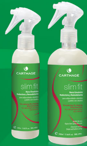
Nano Emulsión Reductora y Remodelante x 200ml y 500ml

Tratamiento intensivo, que actúa eficazmente sobre las adiposidades localizadas y corrige el aspecto de la piel con celulitis.