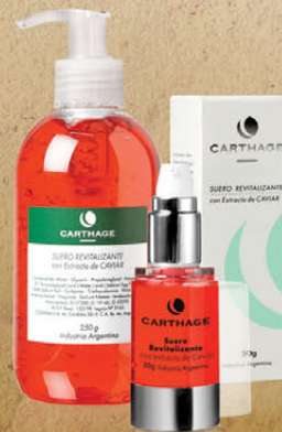
Suero Revitalizante x 30g y 250g

Regenera las células ofreciendo una acción reafirmante, hidratante y tonificante. Apto aparatología.