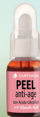
Peel Antiage Renovador Celular con Ácido Glicólico x 25ml

Corrige el envejecimiento de la piel mejorando su calidad, textura y apariencia. Reconstruye y reorganiza las fibras de colágeno y elastina.