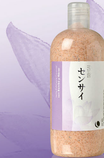
Leche Exfoliante Corporal x 500g

Exfolia, limpia y purifica profundamente la piel dejándola suave y revitalizada. Estimula el proceso de renovación celular.