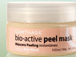
Bio-Active Peel Mask x 100g

Máscara pre-peeling y de limpieza profunda. Combina los efectos del peeling enzimático y AHAS. Facilita la extracción de comedones y elimina impurezas y células muertas favoreciendo la renovación de la piel.