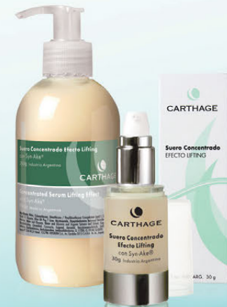
Suero Concentrado Efecto Lifting x 30g y 250g

Con el exclusivo activo Synake® a base de veneno de víbora, permite la relajación de las contracciones del músculo facial dando como resultado una piel lisa.