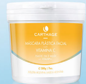
Máscara Plástica Facial con Vit. C x 200g

Posee acción antioxidante. Estimula la formación de colágeno. Mejora la elasticidad de la piel.