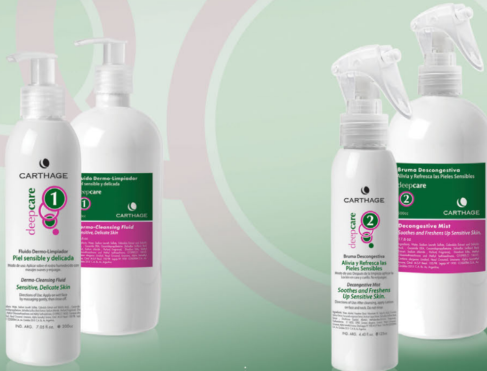
Fluido Dermo-Limpiador x 200cc. y 500cc.

Programa de tratamiento antiedad y reparador que estimula los mecanismos de defensa y alivia la inflamación, disminuyendo las rojeces y otorgando calma y máximo confort a la piel.