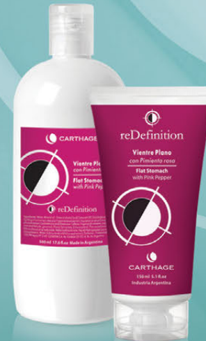
Vientre Plano x 150gr y 500g

Tratamiento intensivo para reducir el exceso de adiposidad acumulada en el abdomen. Drena y reafirma la piel flácida hasta recuperar el tono y las formas atractivas.