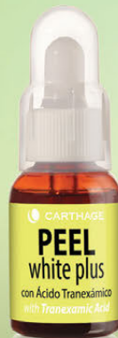
White Plus Peel Renovador Celular con Ácido Tranexámico x 25ml

Tratamiento despigmentante multidimensional que disminuye la hiperpigmentación, logrando una piel más homogénea y luminosa.