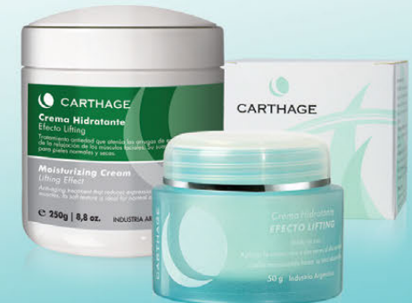
Crema Hidratante Efecto Lifting x 50g y 250g

Tratamiento antiedad que atenúa las arrugas de expresión a través de la relajación de los músculos faciales. Su suave textura es ideal para pieles normales y secas.