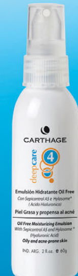
Emulsión Hidratante Oil Free x 60g

Regula la secreción sebácea evitando la dilatación de los poros y el brillo propio de la piel grasa. Hidrata y mantiene su equilibrio.