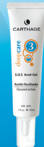
S.O.S. Acné Gel x 30g

Actúa en forma localizada eliminando y previniendo la formación de acné. Sus propiedades astringentes, antisépticas, calmantes y cicatrizantes reducen las impurezas de los poros.