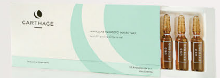
Ampollas Humecto-Nutritivas con Vitamina C x 10 unidades de 3cc.

Concentrado de acción antioxidante y energizante celular, aporta a la piel hidratación y nutrición. Apto aparatología.