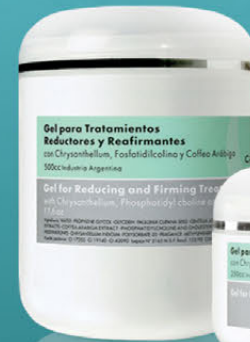
Gel para Tratamientos Reductores y Reafirmantes x 250cc. y 500cc.

Con acción lipolítica, reafirmante y anticelulítica. Apto aparatología.