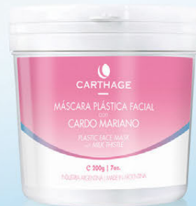
Máscara Plástica Facial con Cardo Mariano x 200g

Ideal para tratamientos antiage, con poderosa acción antioxidante, oclusiva y tensora. Transforma los radicales libres en compuestos más estables y menos reactivos.