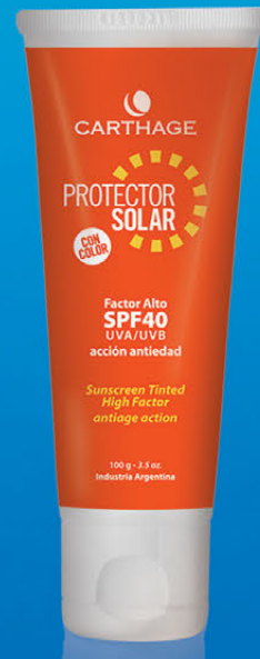
Protector Solar Factor Alto SPF 40 x 100g CON y SIN COLOR

Emulsión protectora solar de acción antiedad que facilita un bronceado uniforme y seguro. Su fórmula dermatológicamente testada proporciona una equilibrada protección de alto espectro UVA / UVB, previene el envejecimiento prematuro y la aparición de arrugas y manchas.