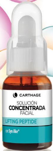
Solución Concentrada Facial Lifting Peptide x 25cc. con Syn Ake

Demotratamientos en gotas ricos en ingredientes activos que ayudan a personalizar y potenciar los cuidados faciales habituales, adaptándolos a las necesidades específicas de cada piel. Apto aparatología.