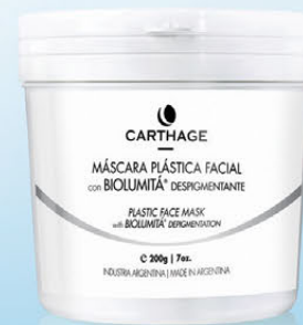
Máscara Plástica Facial con Biolumitá® Despigmentante x 200g

Ideal para todo tipo de pieles. Atenúa manchas, mejora el tono de la piel y aporta luminosidad al rostro.