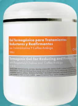
Gel Termogénico para Tratamientos Reductores y Reafirmantes x 500cc.

Productos potenciados contra la celulitis y la obesidad localizada. Estimulan la actividad lipolítica, combaten la flacidez y favorecen el drenaje de los líquidos retenidos en los tejidos. Mejoran la microcirculación aportando firmeza y tonificación a la piel.