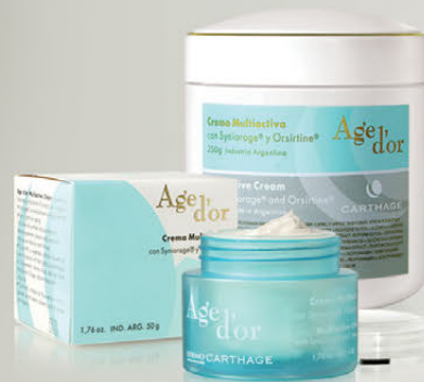
Crema Multiactiva Age D'or x 50g y 250g

Una combinación de fórmulas únicas capaces de desacelerar el paso del tiempo.