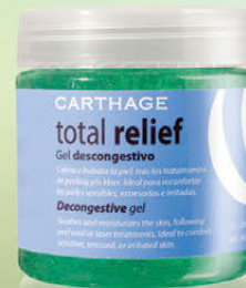
Total Relief Gel Descongectivo x 200g

Una exfoliación gradual con resultados óptimos para cada tipo de lesiones cutáneas.