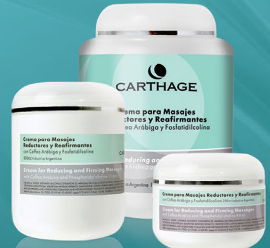
Crema para Masajes Reductores y Reafirmantes x 250cc. y 500cc.

Trata la obesidad localizada, mejora la apariencia de la piel con celulitis, combate la flacidez y favorece el drenaje.