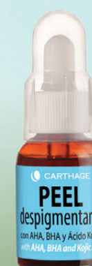
Peel Despigmentante Renovador Celular con AHA, BHA y Ácido Kójico x 25ml

Blend de activos que combaten los factores causantes de la hiperpigmentación y el tono desigual de la piel.