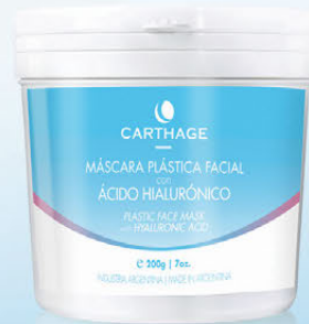
Máscara Plástica Facial con Ácido Hialurónico x 200g

Ideal para todo tipo de pieles. Potencia el efecto hidratante. Aporta firmeza y elasticidad. Previene y reduce la apariencia de las líneas de expresión y arrugas.