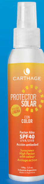
Protector Solar Factor Alto SPF 40 Textura Ligera x 100ml CON y SIN COLOR

Protector solar de acción antiedad que facilita un bronceado uniforme y seguro. Su textura ligera es ideal para pieles normales y grasas.