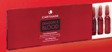
Lipo Lifting Ampollas x 10 u de 3cc.

Tratamiento de potente acción correctiva, tensora y antiage para arrugas profundas y pérdida de firmeza. Combate eficazmente la flacidez y remodela el volumen del contorno óvalo facial, cuello y mentón.