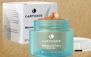
Máscara de Cobre y Caviar x 50g

Con su alto poder antioxidante, aporta firmeza y elasticidad a la piel, acelerando la regeneración cutánea para obtener una piel rejuvenecida.