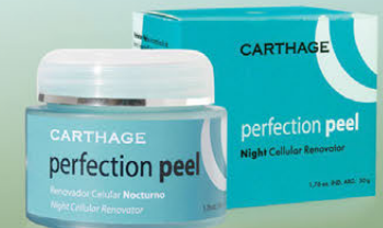
Perfection Peel Renovador Celular Nocturno x 50g

Activa los mecanismos de reparación de la piel durante la noche. Imita el proceso de descamación natural, obteniendo una piel más tersa, luminosa e hidratada. Intensifica, acelera y maximiza el resultado del peeling.