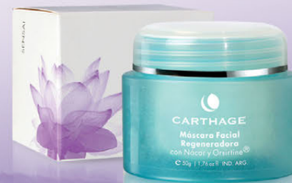
Máscara Facial Regeneradora con Nácar x 50g

Una línea cosmética sensorial inspirada en la filosofía ancestral de oriente que prioriza el equilibrio entre mente y cuerpo. Aromas y texturas que logran despertar nuestros sentidos, activándonos y relajándonos al mismo tiempo.