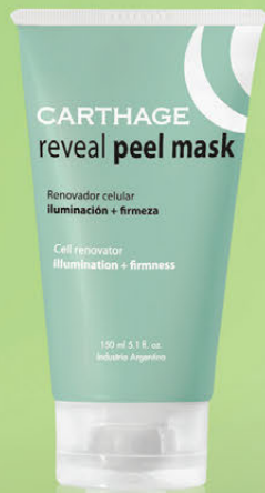
Reveal Peel Mask Renovador Celular con Ácido Láctico y Arginina x 150ml

Una gama de productos inteligentes para problemas individuales de la piel.