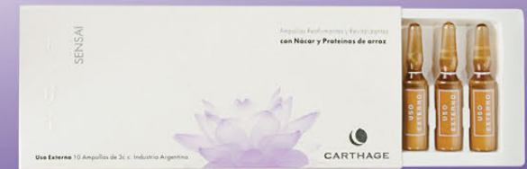
Ampollas Reafirmantes y Revitalizantes x 10u de 3cc.

Antioxidante natural con efecto reestructurante e hidratante. Su textura aterciopelada brinda una delicada sensación de suavidad.