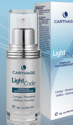
Complejo Despigmentante x 30g

Corrige - Previene - Unifica - Ilumina. Cuidado específico para el tratamiento de las hiperpigmentaciones y el fotoenvejecimiento. Unifica de manera excepcional el tono y la textura cutánea dejando el cutis uniforme y luminoso.