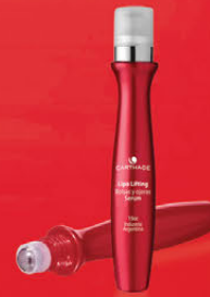
Lipo Lifting Bolsas y Ojeras Serum x 15cc.

Acción drenante y correctora. Reafirma, descongiona y reduce las bolsas minimizando las ojeras y arrugas.