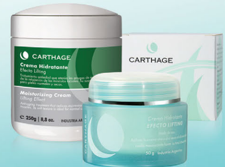
Crema Hidratante Efecto Lifting x 50g y 250g

Tratamiento antiedad que atenúa las arrugas de expresión a través de la relajación de los músculos faciales. Su suave textura es ideal para pieles normales y secas.