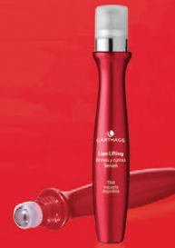
Lipo Lifting Bolsas y Ojeras Serum x 15cc.

Acción drenante y correctora. Reafirma, descongiona y reduce las bolsas minimizando las ojeras y arrugas.