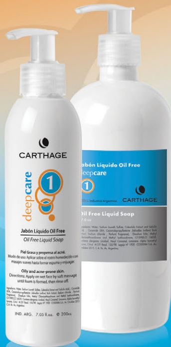
Jabón Líquido Oil Free x 200cc. y 500cc.

Programa de tratamiento para prevenir y combatir el acné en pieles grasas o mixtas.