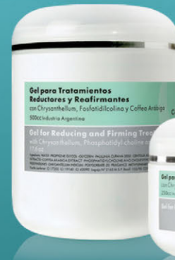
Gel para Tratamientos Reductores y Reafirmantes x 250cc. y 500cc.

Con acción lipolítica, reafirmante y anticelulítica. Apto aparatología.