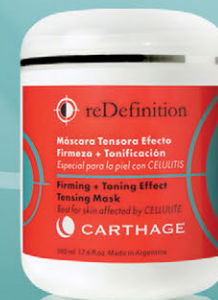
Máscara Tensora Efecto Firmeza + Tonificación x 500ml

Tratamiento reafirmante, tensor y drenante. Ayuda a eliminar la celulitis más rebelde, estimula la circulación y potencia la producción de colágeno recuperando la elasticidad y el tono.