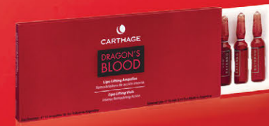
Lipo Lifting Ampollas x 10 u de 3cc.

Tratamiento de potente acción correctiva, tensora y antiage para arrugas profundas y pérdida de firmeza. Combate eficazmente la flacidez y remodela el volumen del contorno óvalo facial, cuello y mentón.