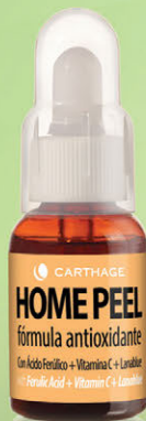
Home Peel Fórmula Antioxidante con Ác. Ferúlico + Vit. C + Lanablu x 25ml

Peeling domiciliario que protege de la oxidación, neutraliza el impacto de los radicales libres en las células retrasando el proceso de envejecimiento cutáneo. Estimula la síntesis de colágeno y elastina, hidrata, renueva y desintoxica.