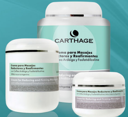
Crema para Masajes Reductores y Reafirmantes x 250cc. y 500cc.

Trata la obesidad localizada, mejora la apariencia de la piel con celulitis, combate la flacidez y favorece el drenaje.