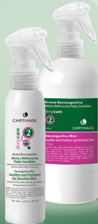
Bruma Descongestiva x 125cc. y 500cc.

Calma, relaja y reequilibra la piel aportándole la hidratación necesaria.