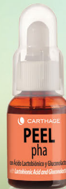
PHA PEEL Renovador Celular con Ácido Lactobiónico y Gluconolactona x 25ml

Tratamiento antiage que concentra la máxima eficacia antioxidante y renovadora, otorgando hidratación, firmeza y elasticidad sin causar picor ni ardor.