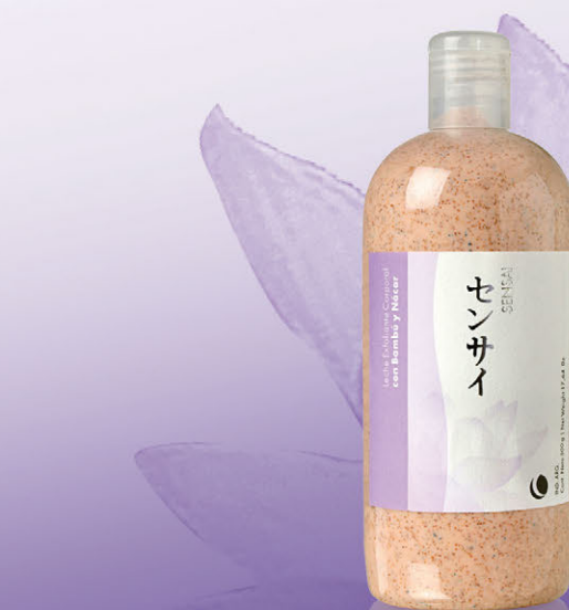
Leche Exfoliante Corporal x 500g

Exfolia, limpia y purifica profundamente la piel dejándola suave y revitalizada. Estimula el proceso de renovación celular.