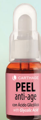
Peel Antiage Renovador Celular con Ácido Glicólico x 25ml

Corrige el envejecimiento de la piel mejorando su calidad, textura y apariencia. Reconstruye y reorganiza las fibras de colágeno y elastina.