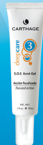
S.O.S. Acné Gel x 30g

Actúa en forma localizada eliminando y previniendo la formación de acné. Sus propiedades astringentes, antisépticas, calmantes y cicatrizantes reducen las impurezas de los poros.