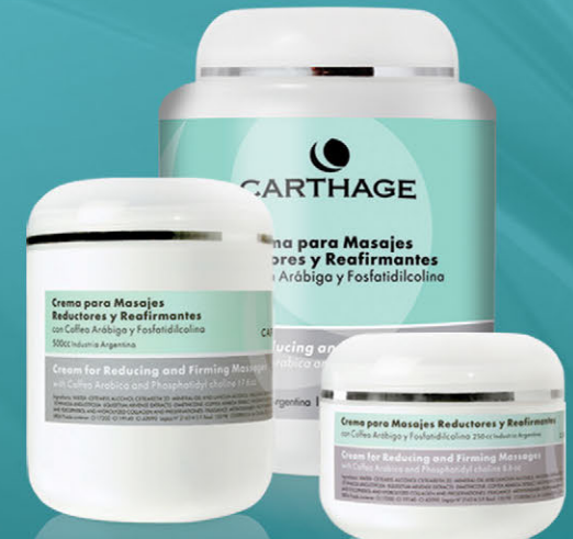
Crema para Masajes Reductores y Reafirmantes x 250cc., 500cc. y 1000cc.

Trata la obesidad localizada, mejora la apariciencia de la piel con celulitis, combate la flacidez y favorece el drenaje.