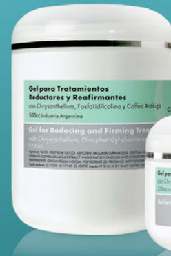
Gel para Tratamientos Reductores y Reafirmantes x 250cc. y 500cc.

Con acción lipolítica, reafirmante y anticelulítica. Apto aparatología.