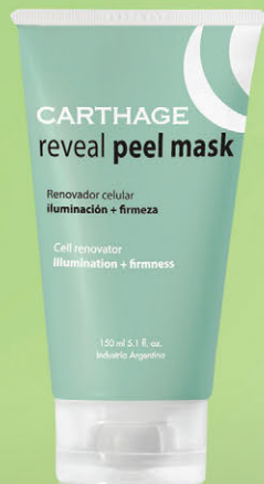
Reveal Peel Mask Renovador Celular con Ácido Láctico y Arginina x 150ml

Una gama de productos inteligentes para problemas individuales de la piel.