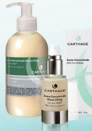
Suero Concentrado Efecto Lifting x 30g y 250g

Con el exclusivo activo Synake® a base de veneno de víbora, permite la relajación de las contracciones del músculo facial dando como resultado una piel lisa.