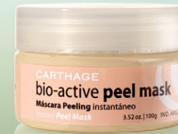
Bio-Active Peel Mask x 100g

Máscara pre-peeling y de limpieza profunda. Combina los efectos del peeling enzimático y AHAS. Facilita la extracción de comedones y elimina impurezas y células muertas favoreciendo la renovación de la piel.