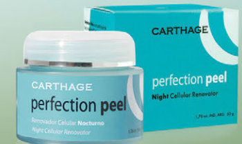
Perfection Peel Renovador Celular Nocturno x 50g

Activa los mecanismos de reparación de la piel durante la noche. Imita el proceso de descamación natural, obteniendo una piel más tersa, luminosa e hidratada. Intensifica, acelera y maximiza el resultado del peeling.