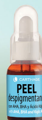
Peel Despigmentante Renovador Celular con AHA, BHA y Ácido Kójico x 25ml

Blend de activos que combaten los factores causantes de la hiperpigmentación y el tono desigual de la piel.