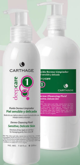
Fluido Dermo-Limpiador x 200cc. y 500cc.

Programa de tratamiento antiedad y reparador que estimula los mecanismos de defensa y alivia la inflamación, disminuyendo las rojeces y otorgando calma y máximo confort a la piel.