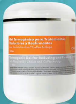
Gel Termogénico para Tratamientos Reductores y Reafirmantes x 500cc.

Productos potenciados contra la celulitis y la obesidad localizada. Estimulan la actividad lipolítica, combaten la flacidez y favorecen el drenaje de los líquidos retenidos en los tejidos. Mejoran la microcirculación aportando firmeza y tonificación a la piel.