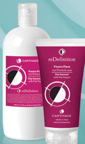
Ventre Plano x 150gr y 500g

Tratamiento intensivo para reducir el exceso de adiposidad acumulada en el abdomen. Drena y reafirma la piel flácida hasta recuperar el tono y las formas atractivas.