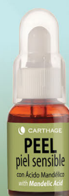
Peel Piel Sensible Renovador Celular con Ácido Mandélico x 25ml

Tratamiento antiage para piel sensible y acnéica. Trata el acné activo, sus secuelas, cicatrices y manchas post acné.