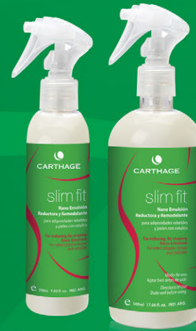
Nano Emulsión Reductora y Remodelante x 200ml y 500ml

Programa corporal que combate las adiposidades más rebeldes basado en el exclusivo activo Drosera Ramentecea liposomada , que "devora" la grasa más rebelde modelando la figura y devolviéndole al cuerpo su forma y armonía.