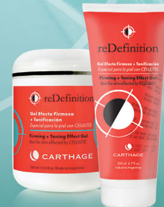
Gel Efecto Firmeza + Tonificación x 200ml y 500ml

Tratamiento reafirmante y tonificante. Combate la celulitis, estimula la microcirculación y mejora el aspecto de la piel "de naranja". Apto aparatología.