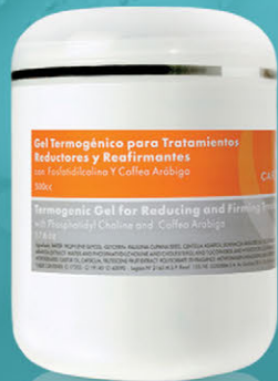
Gel Termogénico para Tratamientos Reductores y Reafirmantes x 500cc.

Productos potenciados contra la celulitis y la obesidad localizada. Estimulan la actividad lipolítica, combaten la flacidez y favorecen el drenaje de los líquidos retenidos en los tejidos. Mejoran la microcirculación aportando firmeza y tonificación a la piel.