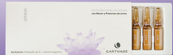
Ampollas Reafirmantes y Revitalizantes x 10u de 3cc.

Antioxidante natural con efecto reestructurante e hidratante. Su textura aterciopelada brinda una delicada sensación de suavidad.