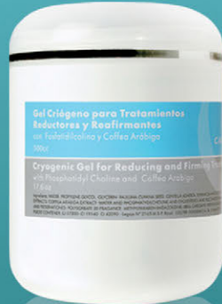
Gel Criogénico para Tratamientos Reductores y Reafirmantes x 500cc.

Gel frío especialmente formulado para problemas circulatorios. Disminuye la celulitis y las grasas localizadas. Con acción reafirmante.