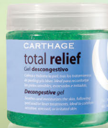
Total Relief Gel Descongestivo x 200g

Una exfoliación gradual con resultados óptimos para cada tipo de lesiones cutáneas.