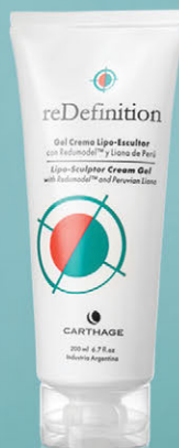
Gel Crema Lipo-Escultor x 200ml

Modela el contorno del cuerpo, combate la adiposidad localizada, corrige el aspecto de la piel con celulitis y posee efecto drenante.