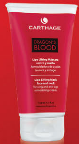
Lipo Lifting Máscara Rostro y Cuello x 150g

Tratamiento de triple acción: antiage, reafirmante y reestructurante. Remodela la zona del óvalo facial consiguiendo un verdadero efecto antigravedad.