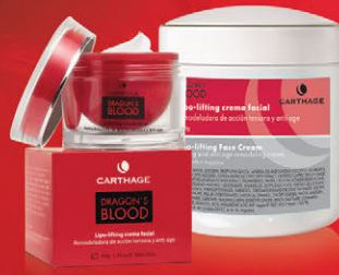
Lipo Lifting Crema Facial x 50g y 250g

Crema de acción correctiva, eleva los rasgos del óvalo facial gracias a su poder reafirmante y reestructurante. Reduce la flacidez y aumenta la elasticidad protegiendo y fortaleciendo las fibras de colágeno.