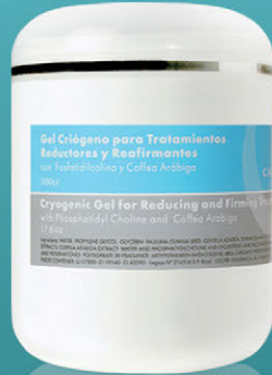
Gel Criogénico para Tratamientos Reductores y Reafirmantes x 500cc.

Gel frío especialmente formulado para problemas circulatorios. Disminuye la celulitis y las grasas localizadas. Con acción reafirmante.