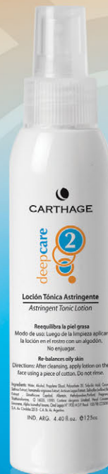
Loción Tónica Astringente x 125cc.

Reduce el tamaño de los poros y controla la oleosidad de la piel dejándola fresca y limpia.