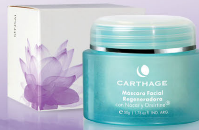
Máscara Facial Regeneradora con Nácar x 50g

Una línea cosmética sensorial inspirada en la filosofía ancestral de oriente que prioriza el equilibrio entre mente y cuerpo. Aromas y texturas que logran despertar nuestros sentidos, activándonos y relajándonos al mismo tiempo.