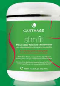
Máscara Lipo-Reductora y Remodelante x 500ml

Tratamiento que redefine el contorno corporal y combate las adiposidades rebeldes.